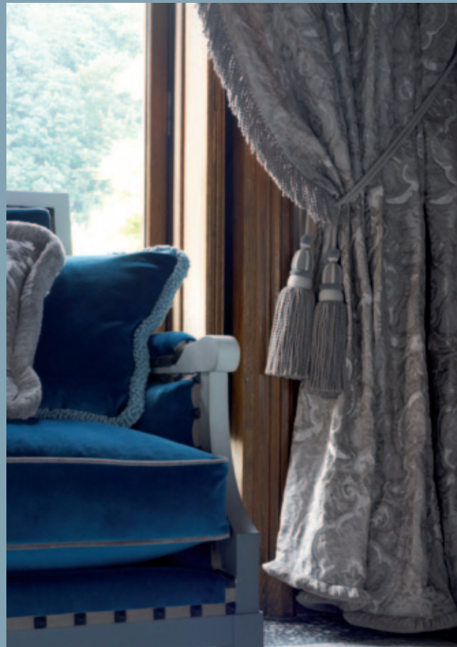
EMBRASSE / TIEBACK : PLAZA, 12 COL.