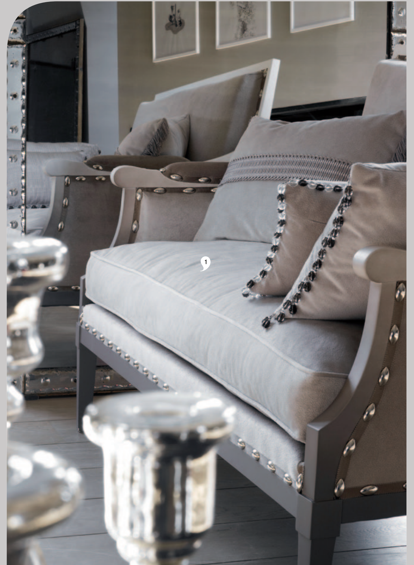
TISSU / FABRIC : EOS