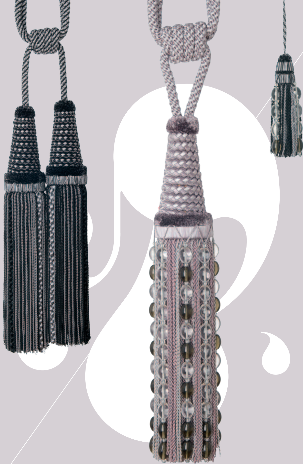
EMBRASSES ET GLANDS DE CLÉ / TIEBACKS AND KEY TASSELS : DIVA