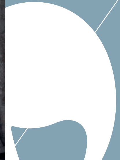
TISSUS / FABRICS : ELEUSIS - EDEN