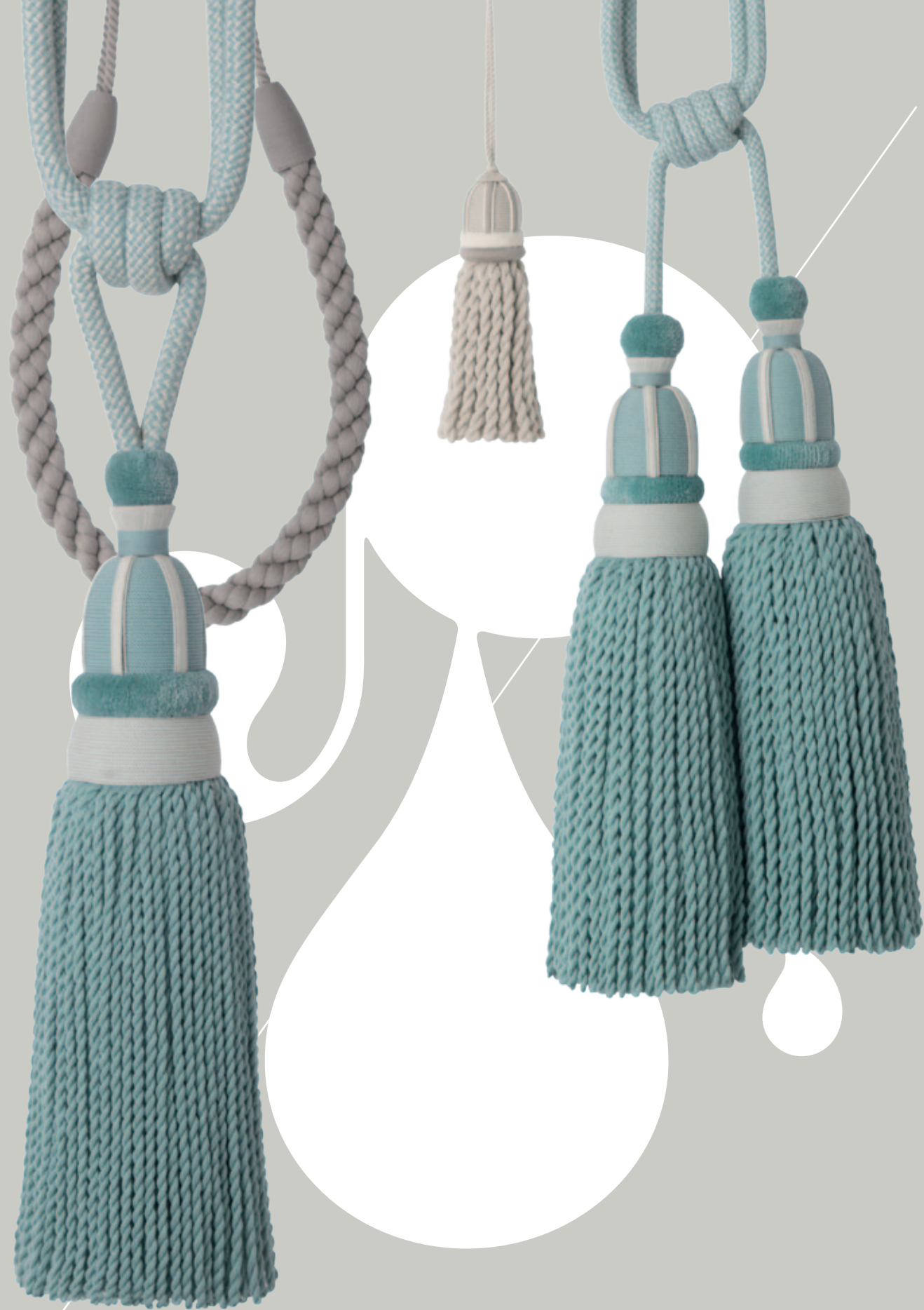
EMBRASSES ET GLANDS DE CLÉ / TIEBACKS AND KEY TASSELS : PLAZA