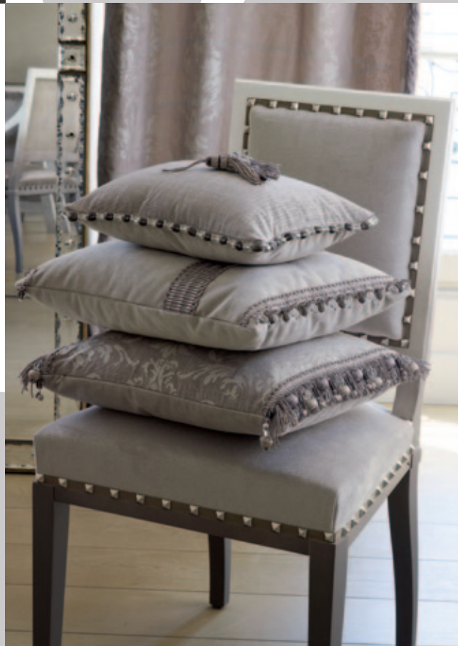
PASSEMENTERIES / TRIMMINGS : DIVA