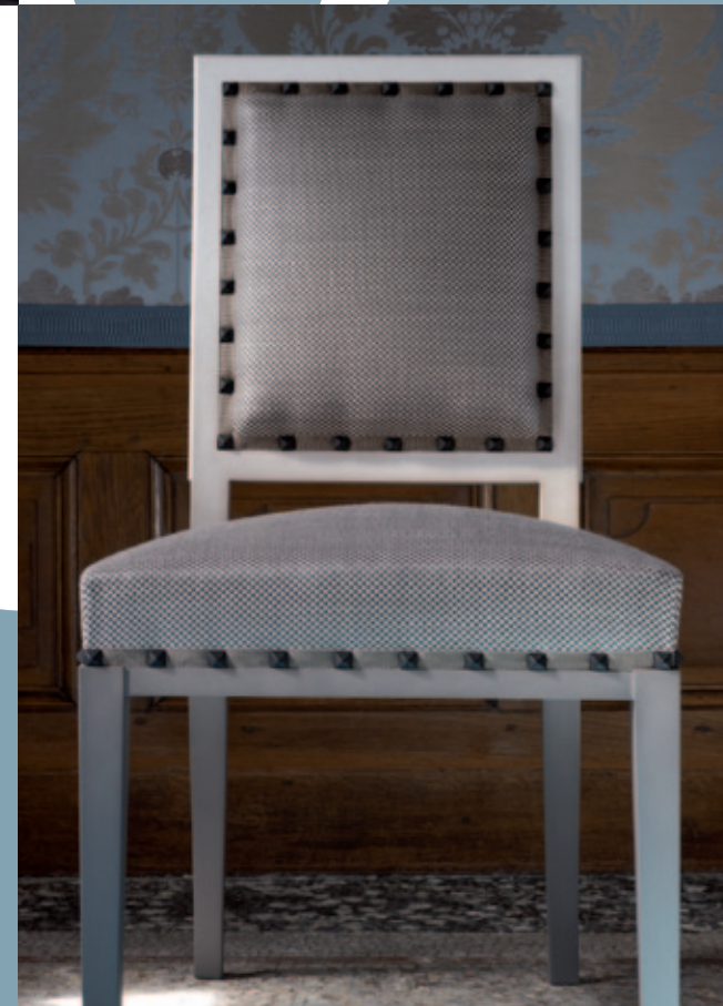
TISSU / FABRIC : EBENE, 12 COL.